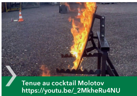
Tenue au cocktail Molotov https://youtu.be/_2MkheRu4NU