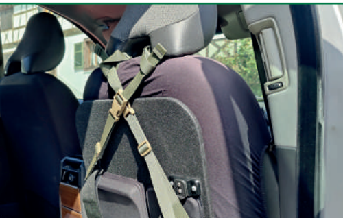
Kit de fixation véhicule

Une rampe d'éclairage et d'éblouissement peut en outre être proposée (option), laquelle est fixée au bouclier par une bande auto-agrippante.