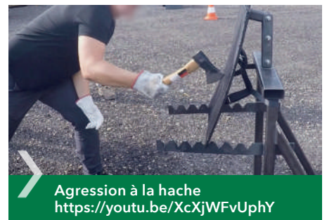
Agression à la hache https://youtu.be/XcXjWFvUphY