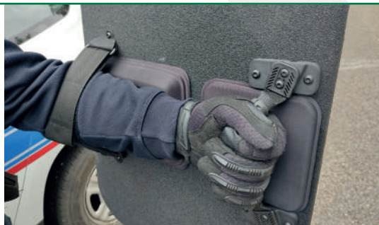
Fixation souple et ambidextre