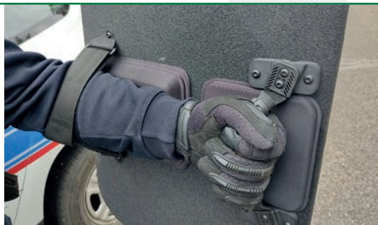
Fixation souple et ambidextre