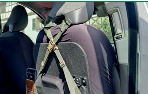
Kit de fixation véhicule

Une rampe d'éclairage et d'éblouissement peut en outre être proposée (option), laquelle est fixée au bouclier par une bande auto-agrippante.