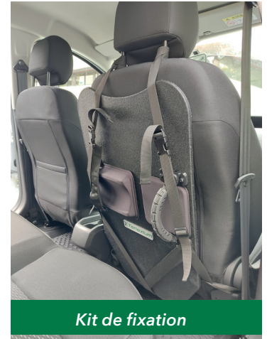
Kit de fixation

Le bouclier T-SHIELD est alors disponible à tout moment.