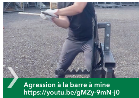
Agression à la barre à mine https://youtu.be/gMZy-9mN-j0