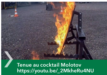
Tenue au cocktail Molotov https://youtu.be/_2MkheRu4NU