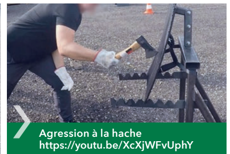
Agression à la hache https://youtu.be/XcXjWFvUphY

29 rue du 14 Juillet F - 67980 Hangenbieten